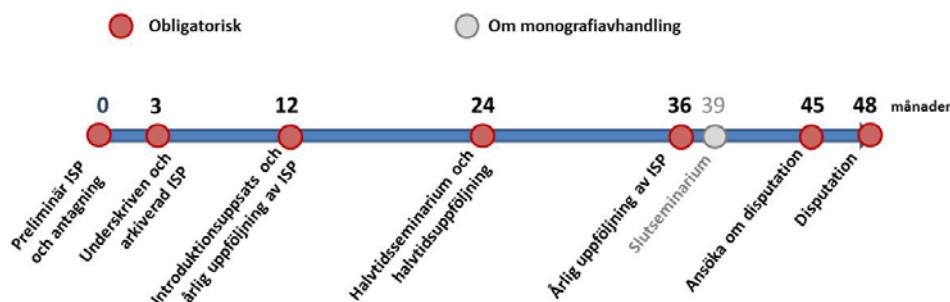
Figur 2. Tidslinje som illustrerar de obligatoriska stegen