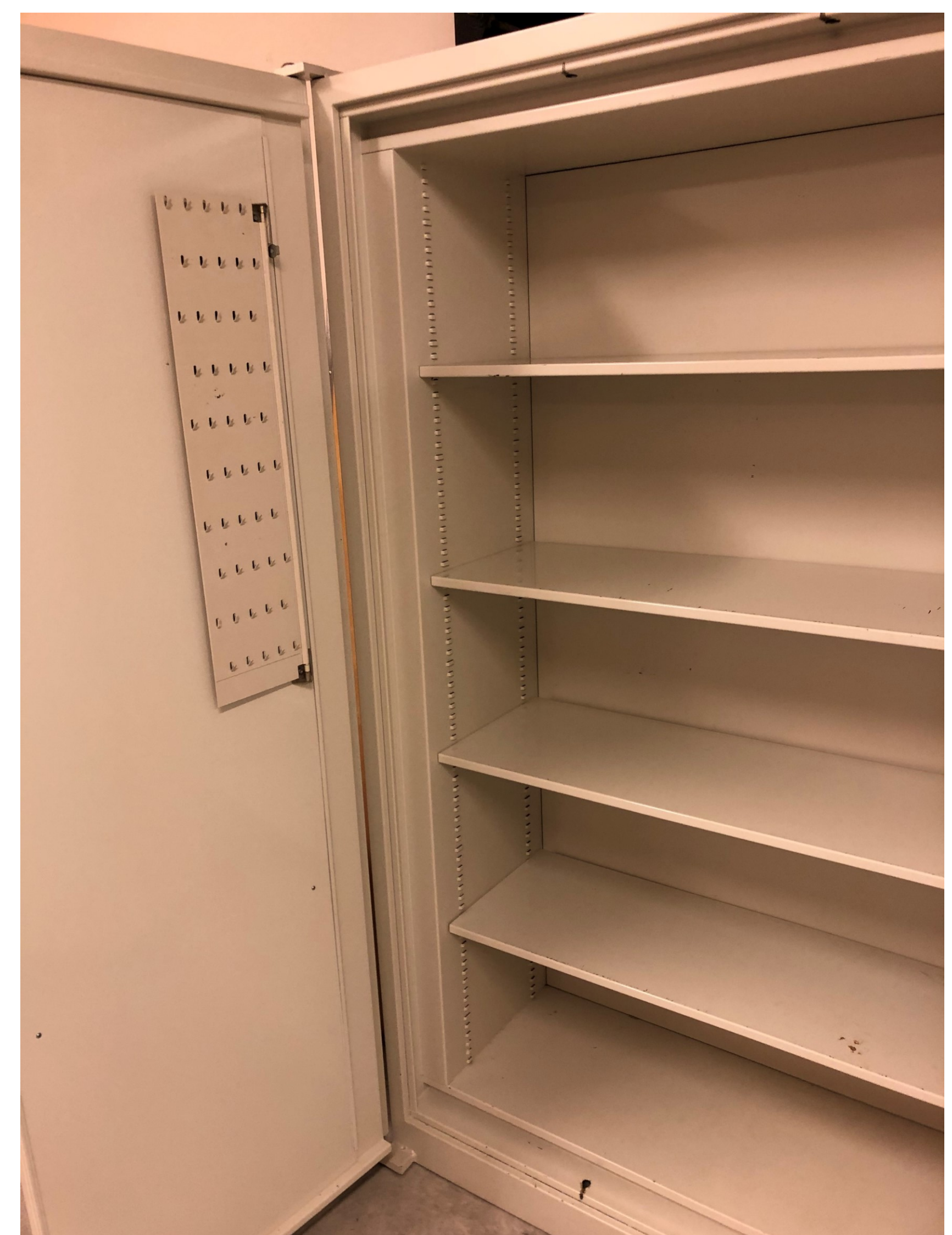
Dokumentskåpet som bortskänkes.