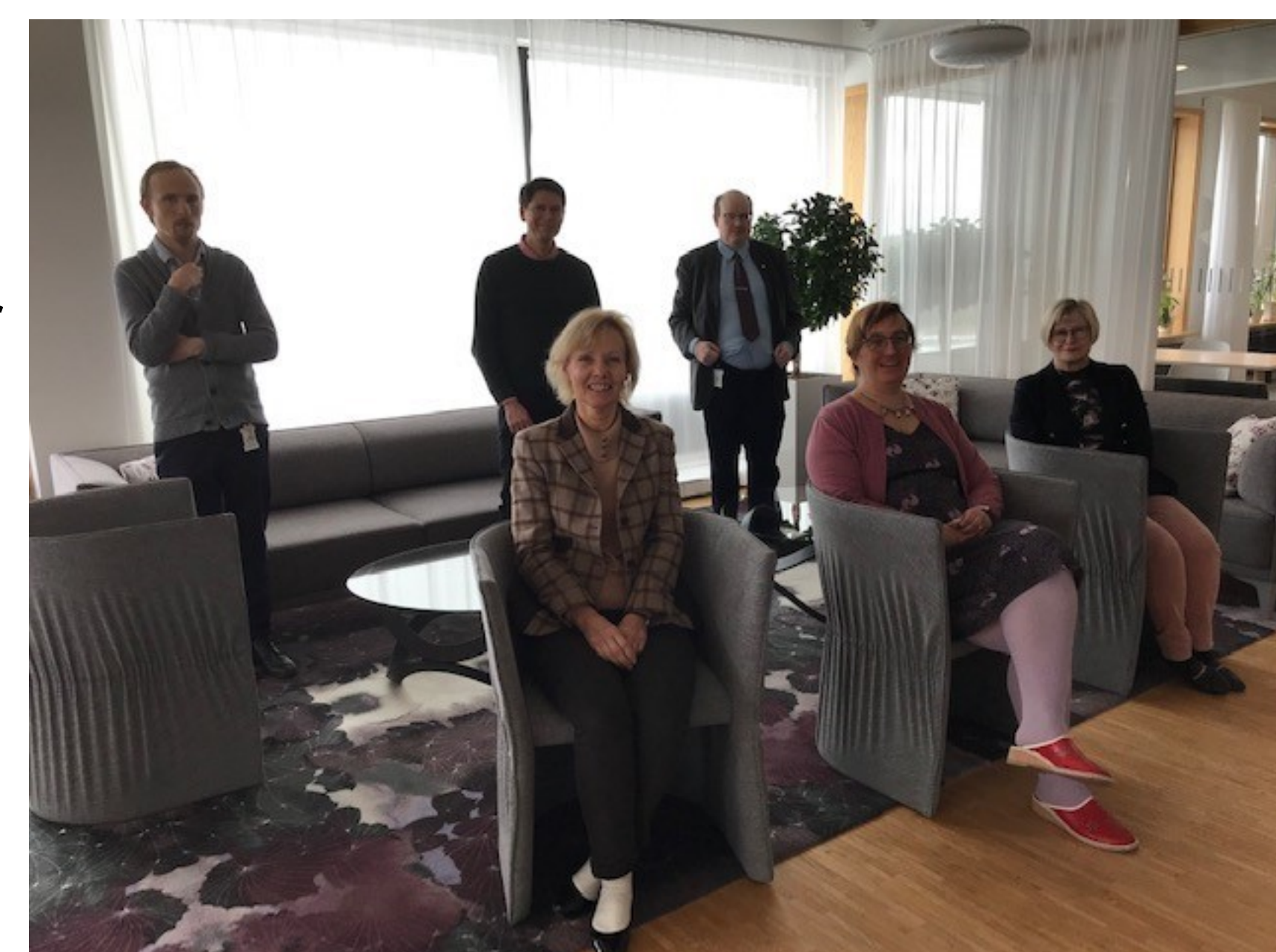
Vi som jobbar på Ledningskansliet/Air

Kontaktuppgifter till enheten finns längst ned på sidorna.