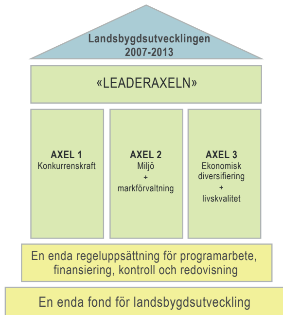
Figur 1. Landsbygdsutvecklingens uppdelning på fyra axlar (Europeiska gemenskaperna, 2006). 2

Landsbygdsprogrammet innehåller även inbyggd (ekonomisk) prioritering av de ekologiska och ekonomiska aspekterna av hållbar utveckling, vilket är en avspeglning av den europeiska jordbrukspolitiken mål och strategier (se Europeiska gemenskaperna 2006).