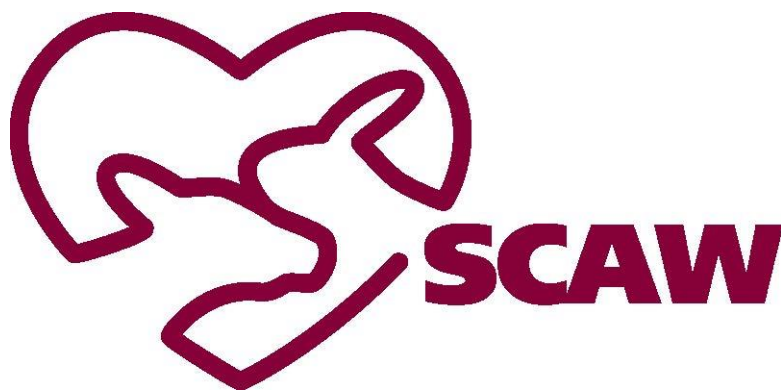
SCAW, Nationellt centrum för djurväl-färds symbol