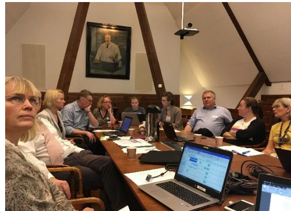
Ett av NordCAWs årliga möten

Sammanfattningsvis är fisk sofistikerade djur med komplexa beteenden, och vi har för länge underskattat deras kognitiva förmåga. Vid NordCAWs möte i Oslo den 15 november påbörjades arbetet med en gemensam forskningsansökan gällande hälsa och välfärd hos mjölkkor och mjölkkraskalvar, där de tre baltiska länderna samt Norge och Sverige kommer att ingå. Baltic Animal Welfare Network (BAWN) tillsammans med SCAW ska även ansöka om fortsatt finansiering från Svenska Institutet samt från the Nordic Joint Committee for Agricultural and Food Research (NKJ).