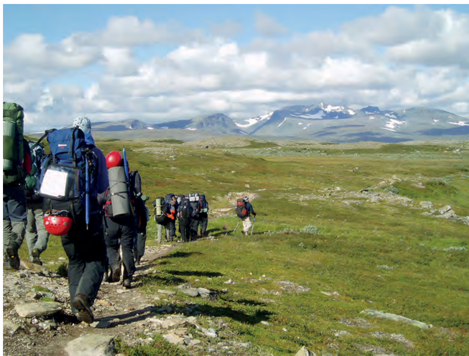
Fjällvandring i Jämtland.

Friluftslivsforskningen är ett brett fält och dess frågeställningar av många slag. Jag kommer att nämna något om bland annat definitioner av friluftsliv och naturturism, besökarstudier och tillgänglighet, eftersom detta på olika sätt kan anknytas till naturvägledning.