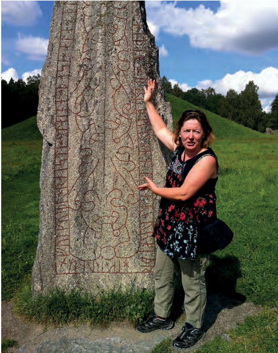
Arkeologiska guidningar är exempel på när natur- och kulturvägledning kan integreras.

landskapet. Studier har gjorts inom forskningsfält som sociologi (t ex Samuelsson, 2008), etnologi (t ex Saltzman, 2001; Daun, 2009), kulturgeografi (t ex Mels, 2002), landskapsplanering (t ex Olwig, 2001 27 ; 2005), human-ekologi och miljöhistoria (t ex Sörlin, 1991) men även filosofi/etik (t ex Uddenberg,