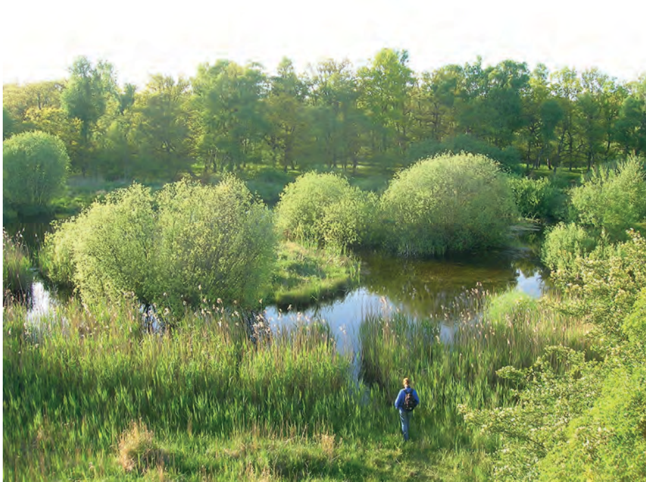
Kan sinnesintryck och känsloupplevelser i naturen förändra människor?

en sådan avgörande naturupplevelse. Ballantyne et al. (2011a) har undersökt naturturisters minnen av en naturvägledningssituation fyra månader senare. De har undersökt minnen av sinnesintryck, samt de känsloupplevelser, tankar och beteenderespons som naturvägledningssituationen innebar och ledde till. Detta resultat menar de kan användas av naturvägledare för att både ge nöjdare deltagare och gynna långsiktiga beteendeförändringar i miljövänlig riktning.