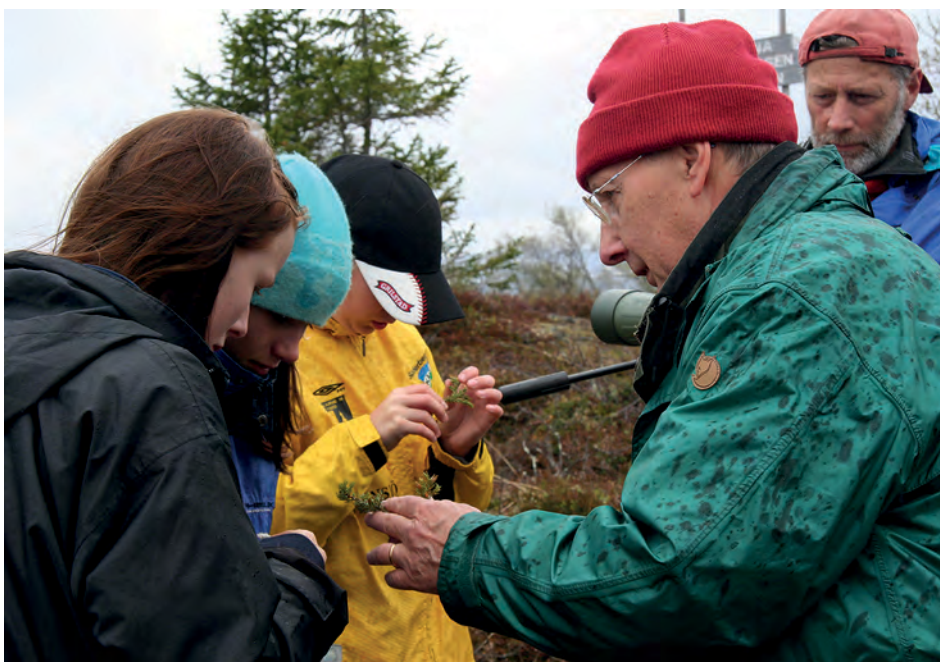
Vad händer i och mellan personerna i en naturvägledningssituation?

En annan väg för forskning om naturvägledning är att rikta blicken mot studier om kultur, samhälle och identitet. Det är forskning som man kommer i kontakt med när man läser exempelvis Samuelsson (2008), Johansson (red, 2006) och Saltzman (2001). Här tror jag att en potential finns för forskning som syftar till att utveckla naturvägledningens didaktik, och för att orientera sig i naturvägledningens roll i samhället nu och i framtiden. Istället för att leta forskning om kulturarv har jag försökt titta efter moderna yttringar, som inte är ren museologi, utan har en koppling till natur, miljö eller landskap. Eftersom interpretation handlar om att tolka en resurs, blir landskapet en symbol och arena för interpretation som strävar efter sammanhang och inkluderar både natur och kultur. Den europeiska landskapskonventionens definition av landskap står också för ett sådant perspektiv. Jag har inte hittat någon forskning om interpretation i förhållande till landskapskonventionen och de ambitioner om delaktighet som hör dit. Det vore dock ett möjligt exempel på framåtsyftande aktionsforskning inom naturvägledning.