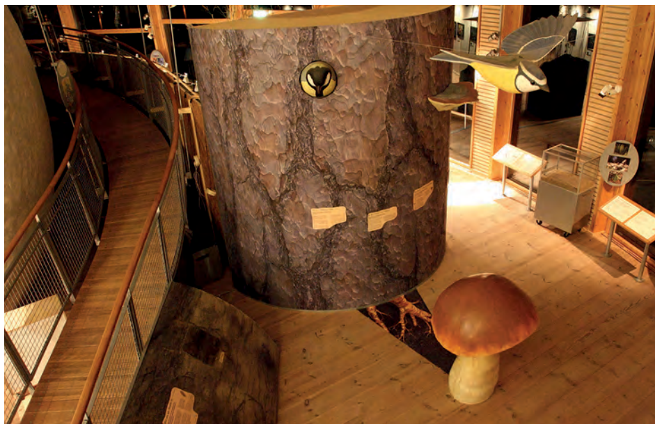
När naturvägledning sker inomhus blir det särskilt uppenbart att "naturmötet" är iscensatt.

Quistgaard & Ingemann (2010) har studerat ungdomar som besöker danska naturvetenskapliga utställningar. De har sett att besökarna behöver stöd för att själva kunna skapa mening utifrån vad de upplever. En guide eller en lärare som aktivt använder dialog hjälper besökaren att själva ställa frågor och rikta sin nyfikenhet mot utställningen. På så sätt uppmuntras egna reflektioner som skapar mening. Särskilt viktigt med dialog är det om miljön upplevs som exkluderande, skriver Quistgaard & Ingemann (2010). Här ser jag en direkt koppling till naturvägledarens roll i en naturvägledningssituation.