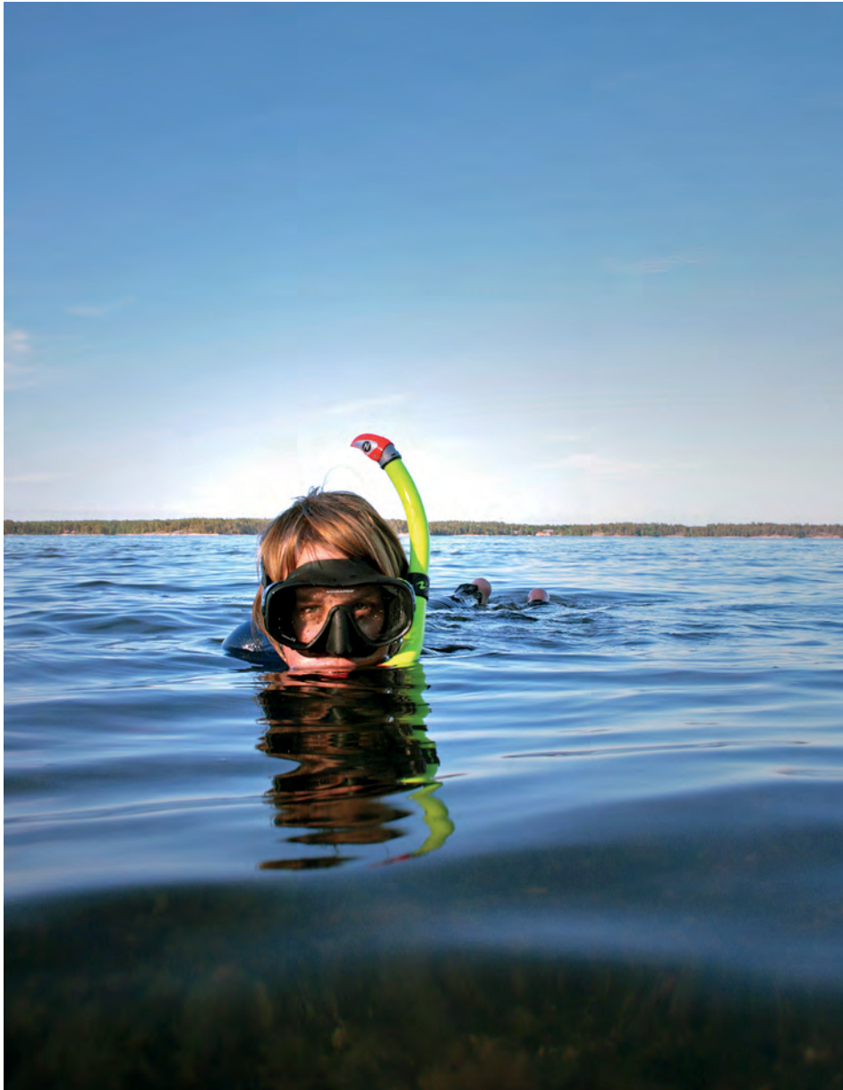
Naturvägledning är en lärandesituation där var och en gör sina egna erfarenheter.

och förbättras. Kohl föreslår fyra olika strategier för att integrera naturvård och naturvägledning: