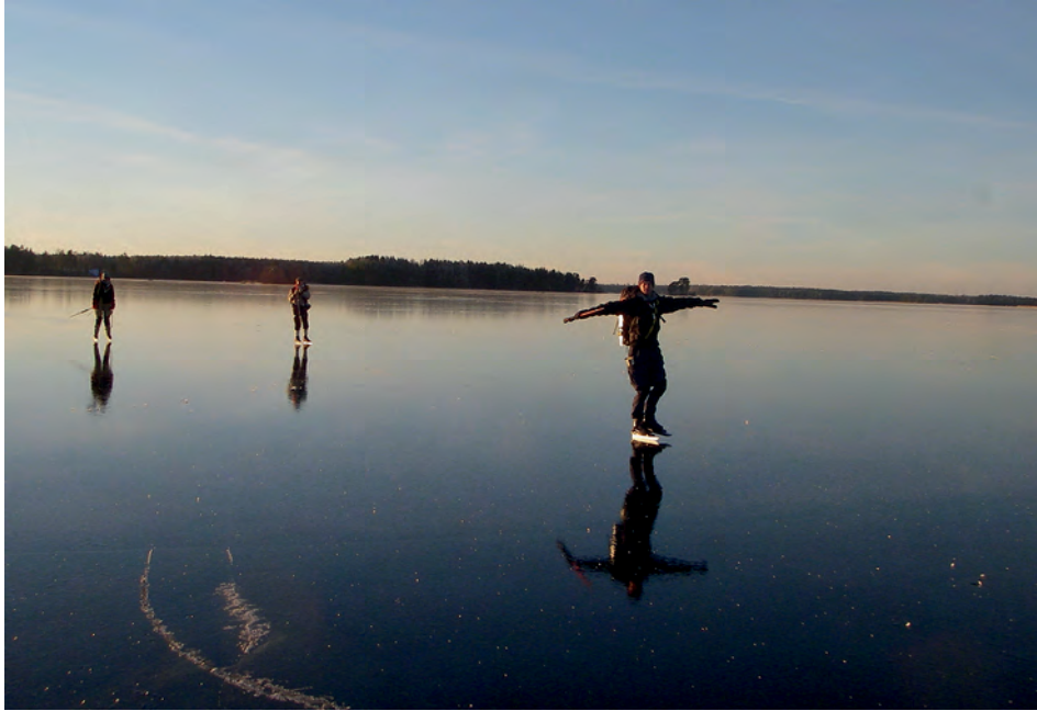
Friluftsliv vintertid.