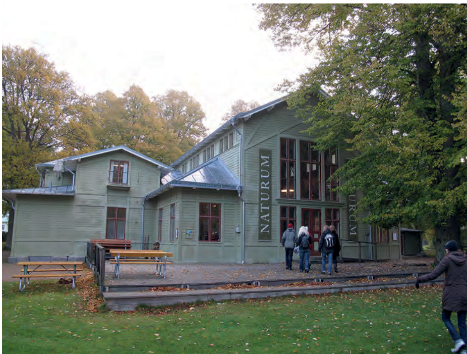
Naturum Blekinge.