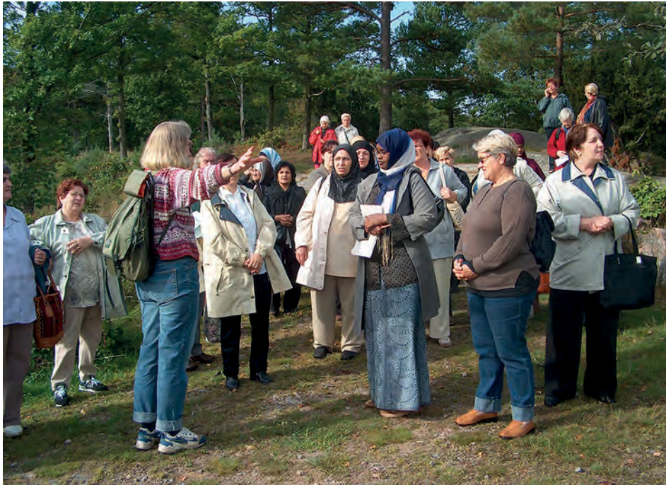
Naturvägledaren behöver ha god kännedom om sin målgrupp.