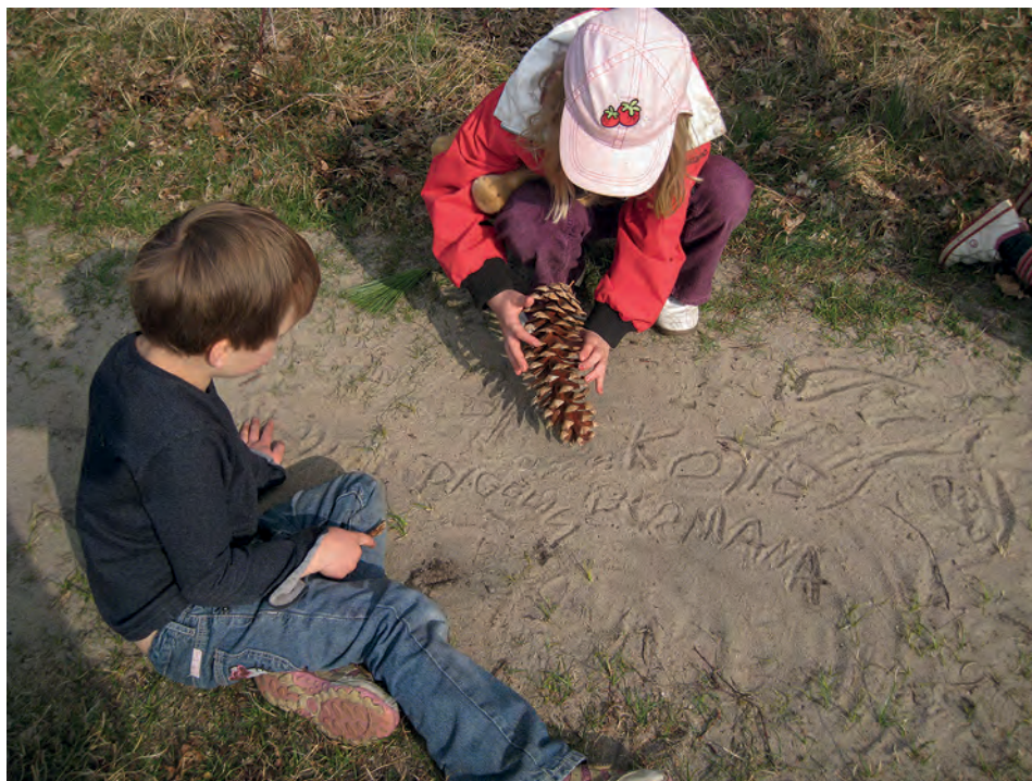
Utomhuspedagogik.