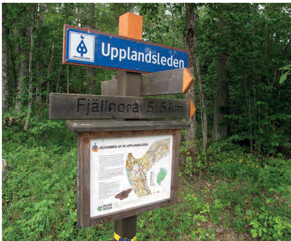
Obemannad naturvägledning kan till exempel vara skyltning och information på plats om ett naturområde.

Syftet var att i första hand fokusera på den typ bemannad och obemannad naturvägledning som sker på plats (t ex naturguidning, natur- och kulturstigar, skyltning) eller i nära anslutning till ett natur- eller kulturlandskap (t ex naturum, ekomuseer 2 , utställningar), med uttalat syfte att berätta om sambanden mellan människa och natur. Här har jag alltså försökt att göra en avgränsning och endast undantagsvis inkluderat naturvägledning via böcker & skrifter, film, webb m fl medier.