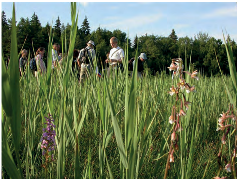
Naturvägledning är ett sätt att informera allmänheten om biologiska värden i ett naturreservat.

Som jag beskrivit i tidigare avsnitt om internationell forskning är naturvägledning på många håll i världen relaterad till naturvård och naturförvaltning. I inledningen av avsnittet om naturvägledning i Sverige visade jag att kopplingen till naturvård och skyddade områden är stark även här. Därför kan det vara relevant att titta på forskning som rör naturvårdens sociala dimensioner. Det handlar t ex om planering för friluftsliv, människors relation till skyddad natur, och urban naturvård (Emmelin et al. , 2005; Stenseke, 2010; Borgström, 2011; Henningsson, 2008). Dock behandlar inte dessa studier naturvägledning explicit.