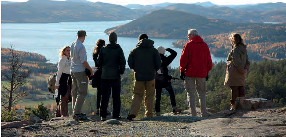
Nature interpretation contributes to constructing our nature experience.

to research would strengthen their quality. However, nature interpretation is not a research discipline, but rather a topic that requires research from various perspectives. That interdisciplinary context could be treated by different branches – from public health science, to cultural studies, to forest sciences, if it is combined with communication science, pedagogics or similar fields. Environmental psychology, marketing and media sciences could also provide knowledge about behavioural impacts that nature interpretation often aims for in a general context.