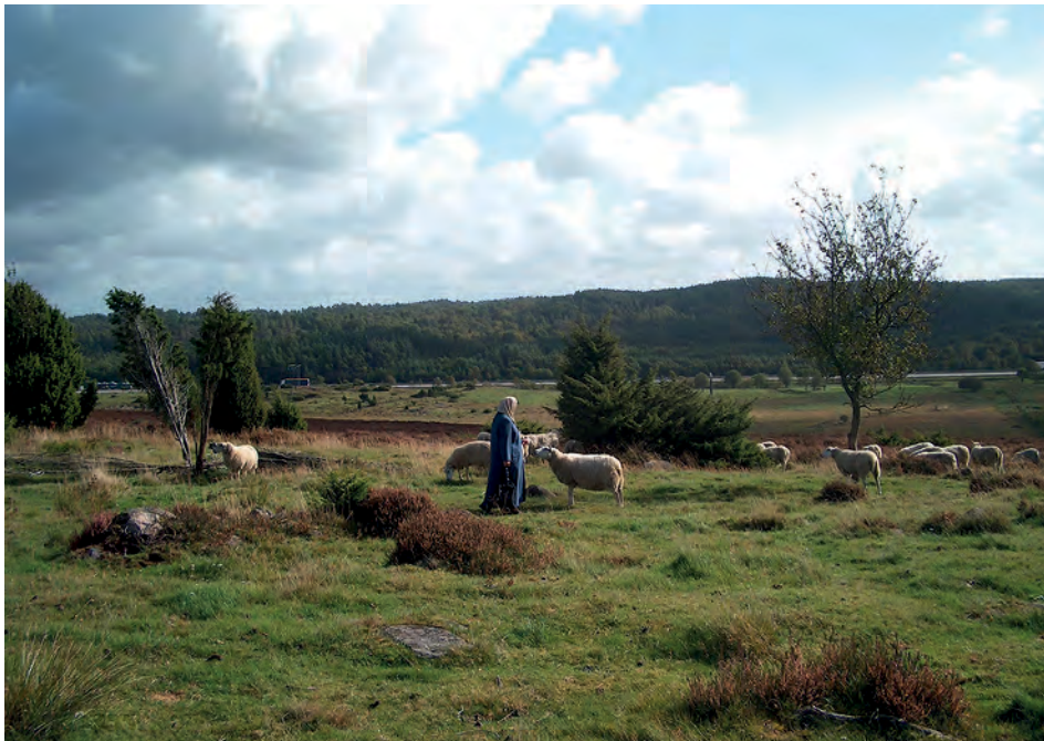
Naturmöte i kulturlandskapet.

Platskänsla är något som angränsar till natursyn. Soini et al. , (2012) har gjort en finsk studie om platskänsla vid den urbana-rurala gränzonen, och landskapet som kuliss eller boplats. En jämförelse av platskänsla hos turister och lokalbefolkning i en nationalpark i Norge presenteras av Kaltenborn & Williams (2002). Diskussionen om dikotomin natur-kultur, samt platskänsla fortsätter lite senare i avsnittet om natursyn.