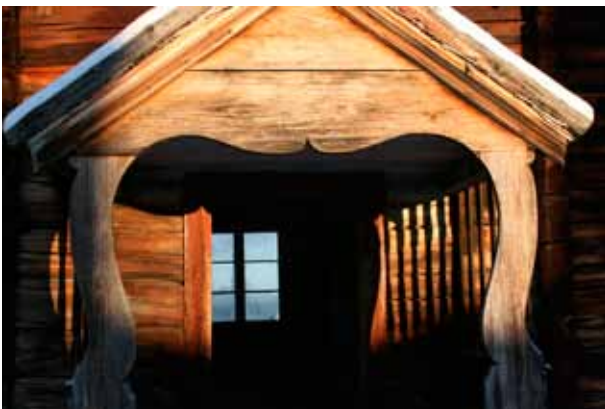
Brokvistens stil är signatur för byggmästare eller socken.