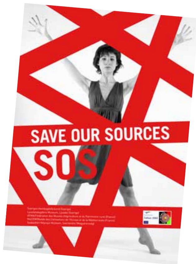
Katalogen till utställningen S.O.S. – save our sources, 2009, som var ett av resultaten av Cult-Rural, ett EU-projekt med fokus på landsbygdens kulturarv som en möjlig resurs för hållbar utveckling.