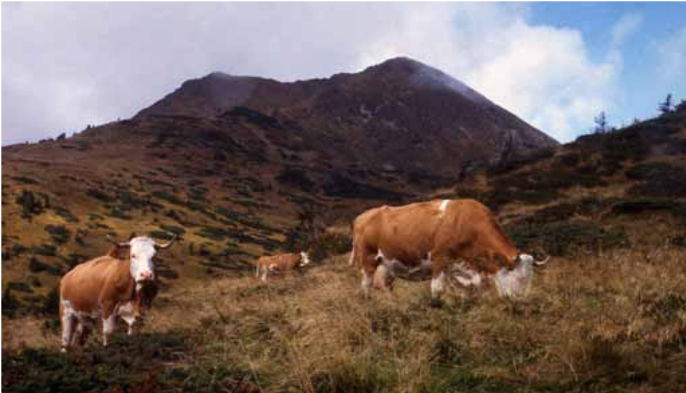
Österrikiska kor på fritt bete i Alperna; Sölker Pass 1800 m.ö.h. Fäboden, almen , finns på några hundra meter lägre nivå. Den öppna betesmarken har tolkats som klimatiskt betingad men det är bekräftat att betet hindrar igenväxning. I Sverige ser vi i dag en påfallande förändring från det traditionella betet på vidsträckt område i fäbodskogen till att i allt större utsträckning i handla om ett hägnat bete av vallens inägor och dess närområde. Historiskt sett betades vallarna först efter skörden. Man kan förvänta sig ekologiska följder.

kraftfullare satsning, som kan innebära att resurser flyttas från stöden till ren jordbruksproduktion, vilket inte är populärt.