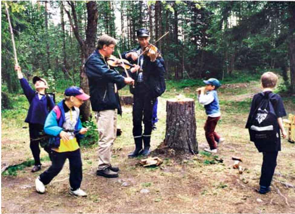
— Hörde du vad fint jag spela på min flöjt, sagt med stor inlevelse och kinder som var röda av glädje. Det var han vid stubben och i röda byxor.

ringen igen pratar lite om barnens upplevelser. Till avslutning har vi en ritual. En av oss gör före och barnen härmar.