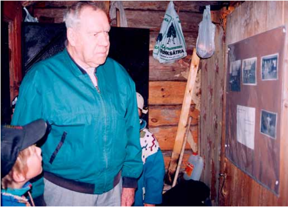
— Där är ju jag när jag var ung!

Vi gläds också åt att ge modersmålsbarnen med andra språk en chans att få svenska ord för företeelser de inte möter i sin nuvarande vardag. Yxa, klyva, kapa, juver, koskälla. Det starkaste minnet var några bosniska killar i 11-årsåldern som kom med sina berättelser om hur det var hos farmor mormor som hade kor. De killarna var så vana med yxan att de kunde spänta tändved utan att vi behövde stå intill som vi annars gör.