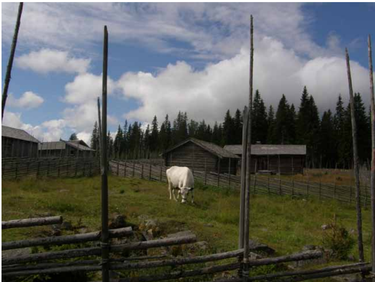
Fäboden är i många ögon ett synnerligen konkret exempel på ett idylliskt kulturarv. Att den faktiskt samtidigt utgör en del av ett lantbruksföretag och att många brukare försöker få sin utkomst från driften är något som alltför få reflekterar över.

Det är min uppfattning att detta har varit negativt för hur man värderar landskapet och det har påverkat de stödsystem som finns inom t.ex. EU:s jordbrukspolitik. Landskapselement typiska för norra Sverige har värderats lägre än de från södra Sverige. Det har varit särskilt tydligt när det gäller träbyggnader, som lador och logar.