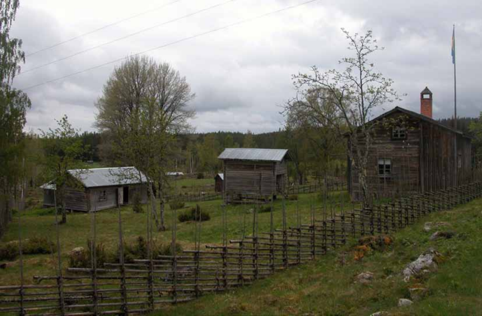
Kulturreseptatet Väsbo fäbod, Ovanåkers kommun.

Fäbodbruket kan också ha problem med att under enkla förhållanden klara vissa av Livsmedelsverkets krav vad gäller livsmedelshygien. Man måste fundera på hur reglerna kan konstrueras så att de både garanterar livsmedelshygien och fäbodbrukarnas existens. Reglerna måste anpassas för fäbodarnas mycket speciella karaktär och tradition.