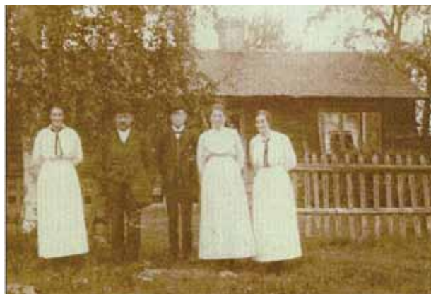
Yttersjö Wilhelms fäbod för ungefär hundra år sedan.

En fäbodpiga var där på 1920-talet. Och hon ritade en skiss över området innan hon dog. Resterna finns kvar. Jag meddelade Mellström på Stora Enso och skickade dit skissen, för att inte skogsmaskiner ska förstöra. En dotter till fäbodpigan var med på vandringen.