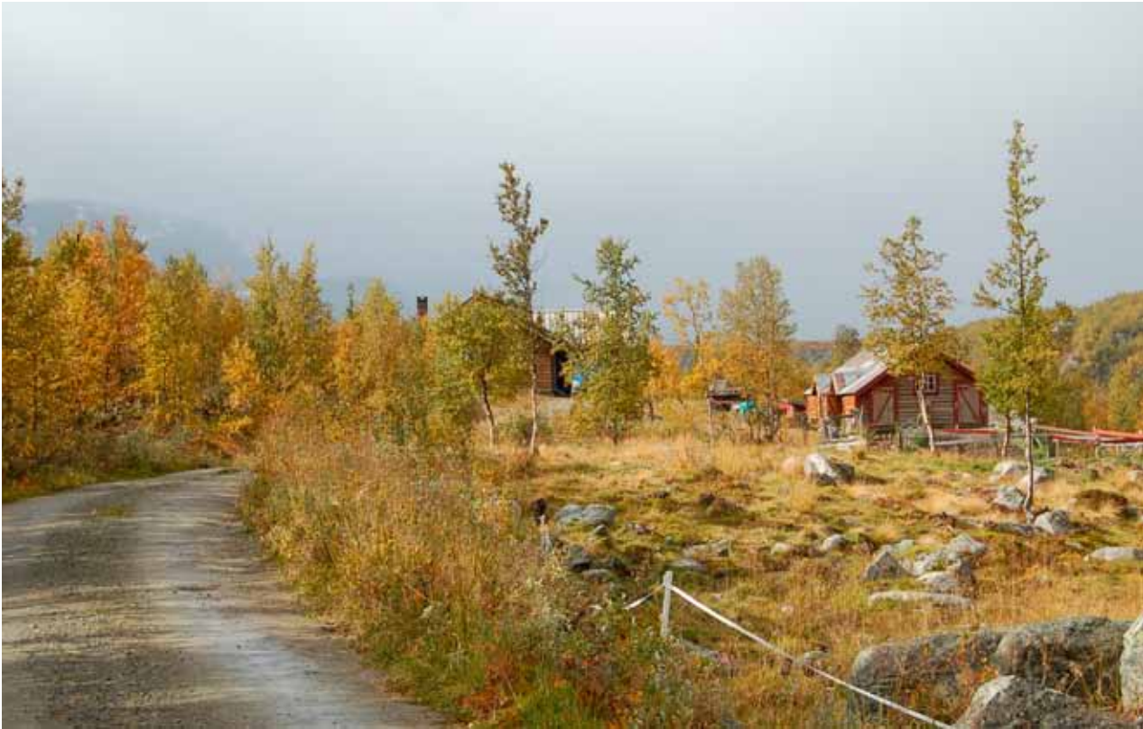
Gurostølen – en fantastisk vacker arbetsplats!

Målet er billigere mat, mer forbruksvarer, mens verden trenger mer mat for at alle skal bli mette.