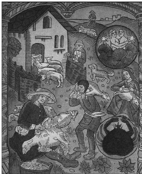
Bilden är hämtad ur en astrologisk kalender från 1488, ger en föreställning av Medelhavsområdets transhumans. Den återfinns i Moreno Massainis bok Transumanza , Rom 2005.

Gemensamt: De som levte "på skogen" ansågs vildare än vanligt folk.