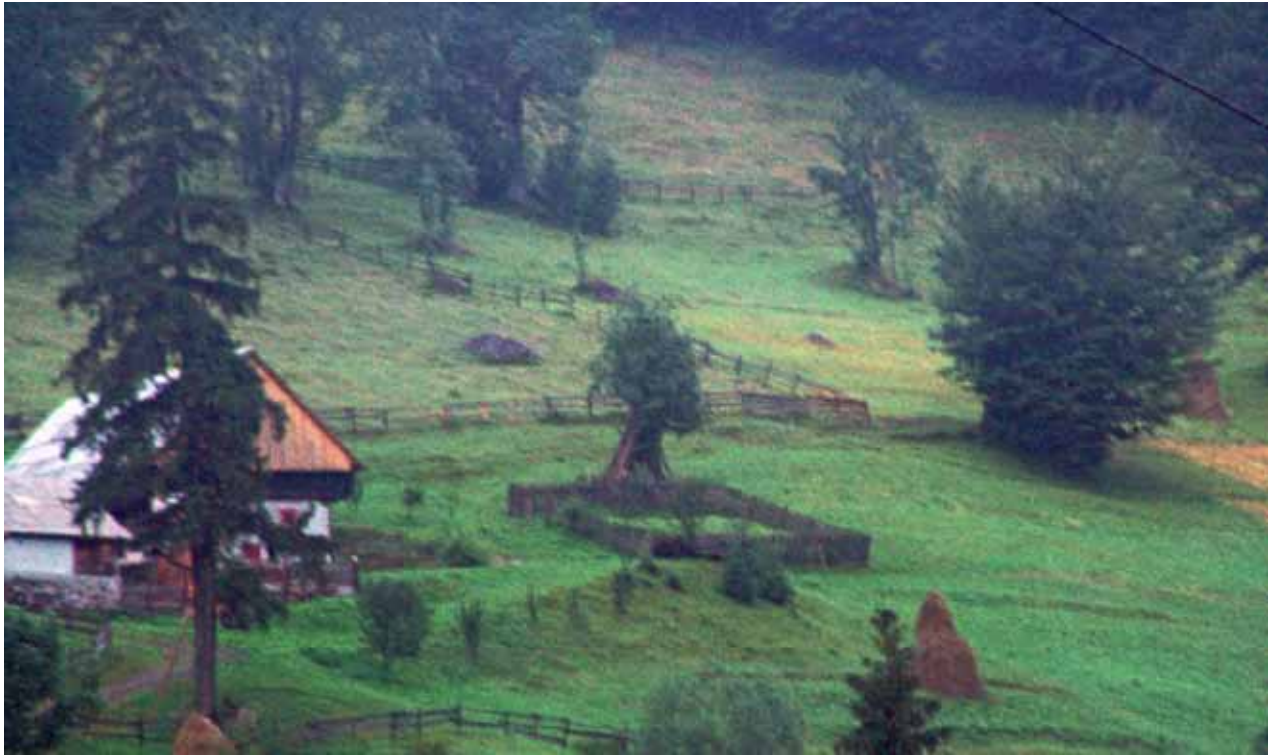
En rörlig nattfälla i västra delen av Rumänien fotograferad en sen kväll i augusti 2005. Ett idag tämligen ovanligt sätt att styra djurens gödsel från utmarkens bete till inägans åkrar.

Praktiken har en avgörande roll för minnet. Den får inte brytas eftersom den inte kan byggas upp igen.