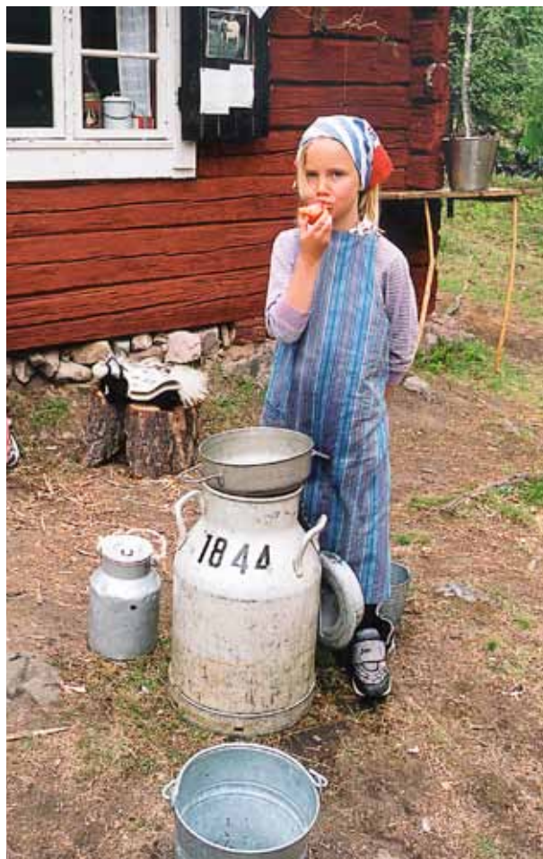
— Kom och köp mjölk!

Dagen på fäboden följer samma mönster. Barnen som kommit med bilar eller cyklat hälsas välkomna stående i ring. Vi berättar om sambandet mellan fäbod, kor, getter och gräs. Vi berättar valda delar av de berätt-