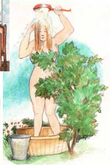
Illustrationer: Anne-Marie Nilsson