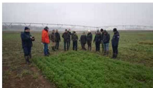
Fältvandring i sommarmellangrödor, Hellegården Skepparslöv den 26 november.