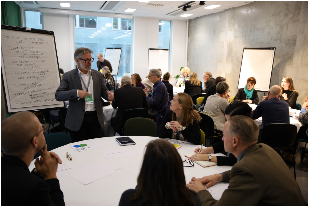
Många goda exempel kom fram.